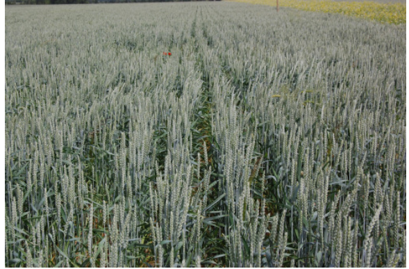
Doppelter Saatreihenabstand

fragt, in ihrem Handeln den Artenschutz zu berücksichtigen. Anders als in anderen Teilbereichen einer Planung existieren im Zusammenhang mit dem Artenschutz keinerlei Abwägungsmöglichkeiten. Dies schließt auch die „einfachen“ Verfahren innerhalb eines landwirtschaftlichen Betriebes mit ein. Hier